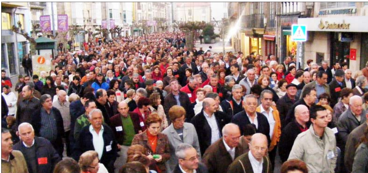
Los manifestantes se dirigen por la calle principal hacia el Ayuntamiento de Reinoso.

Automóviles y camiones de gran tonelaje aparcan en la isleta situada junto a la única entrada al área industrial.